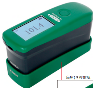
底座(含校准塊, 標配)