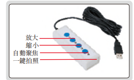
手持控制器(選配, 適用於電視端)