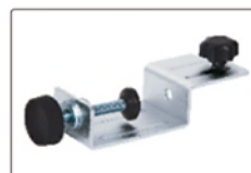
室外探測器支架(標配)