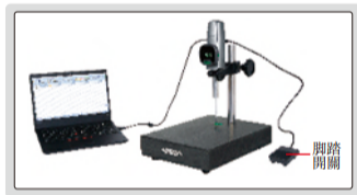
無需安裝軟件，數據可傳輸到Excel； 短按腳踏開關采集數據，長按置零