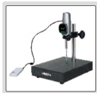
可外接充電寶使用