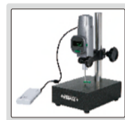
可外接充電寶使用