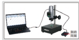
無需安裝軟件，數據可傳輸到Excel； 短按腳踏開關采集數據，長按置零